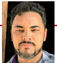
Alexandro Garcia Ribeiro - Presidente

A fome já é realidade para 33 milhões de lares brasileiros. Neste momento já somos aproximadamente 125 milhões sofrendo com a insegurança alimentar, sendo 59 milhões em insegurança leve, 31 milhões em insegurança moderada e 33 milhões em insegurança grave (situação de fome).