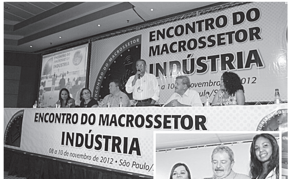
Ex-presidente Lula também participou do evento

Na ocasião foram aprovadas as cláusulas sociais que são fundamentais para a categoria e que estarão presentes em todas as Campanhas Salariais, no ano de 2013, bem como a pauta do Contrato Coletivo Nacional de Trabalho dos Metalúrgicos.