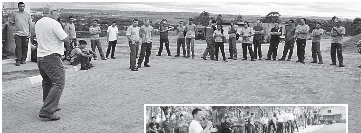
Assembleia de PPR na MMS (acima) e Nagel (ao lado)