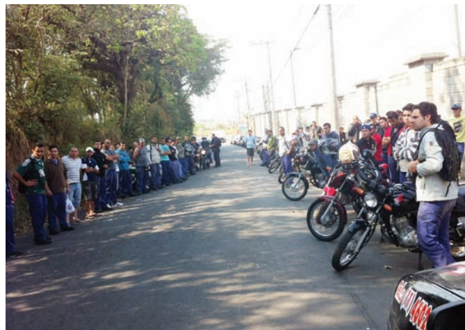
Assembleia na Empresa Nagel (à esquerda) e paralisação na Kanjiko (à direita)

A situação da Campanha Salarial deste ano permanece a mesma que informamos em nossa última edição: truncada.