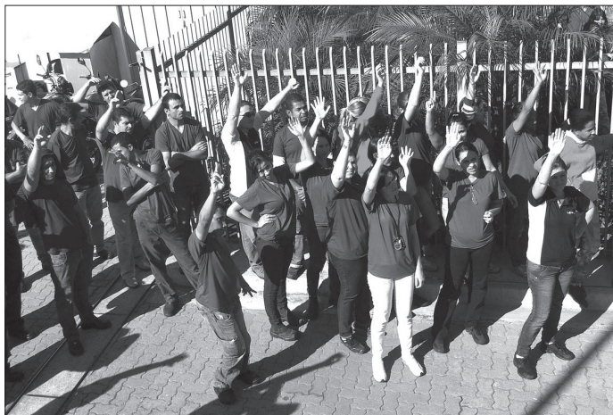
Assembleia de PPR realizada na empresa Inferteq