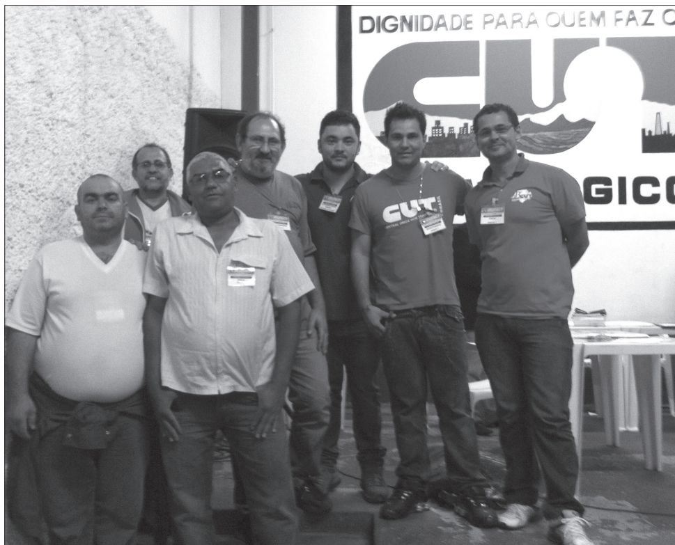
Presença de vários diretores do StimSalto durante as eleições

As eleições do Sindicato dos Metalúrgicos de Pindamonhangaba, acompanhadas pelos diretores do StimSalto, que estiveram presentes para auxiliar os companheiros dessa cidade, terminaram na noite do último dia 6 de junho.