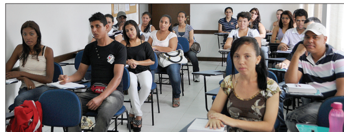
Gestão de qualidade