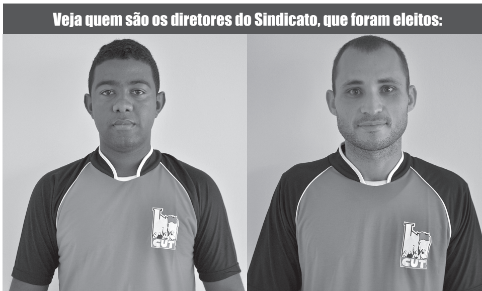
Wellington, primeiro colocado

Veja quem são os diretores do Sindicato, que foram eleitos: