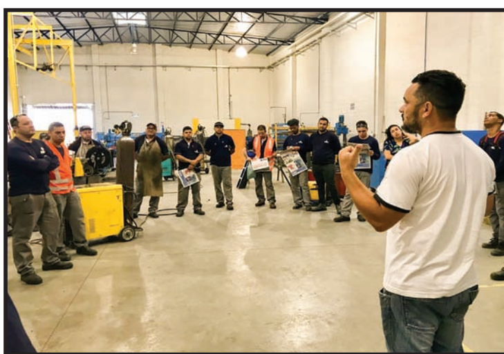
Assembleia na empresa Clemont