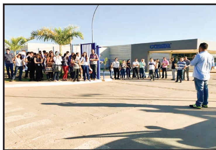
Assembleia com o Administrativo da empresa COBREQ

O Sindicato dos Metalúrgicos de Salto, durante o mês de novembro, atuou nas portas das fábricas das empresas que compõem a base, realizando as discussões para o Aumento Real da Campanha Salarial, ampliando as conquistas e lutando por nenhum direito a menos para os trabalhadores. Outro ponto debatido durante as assembleias, foram os avanços do PPR, conquistado em várias empresas.