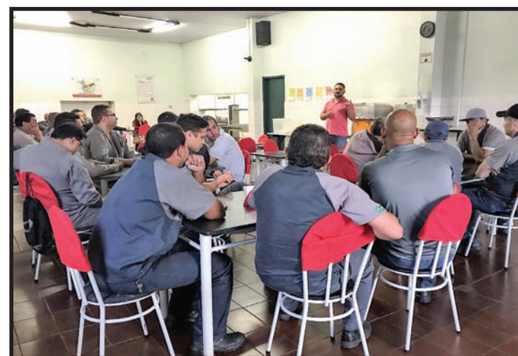
Assembleia na Empresa Metal Coop