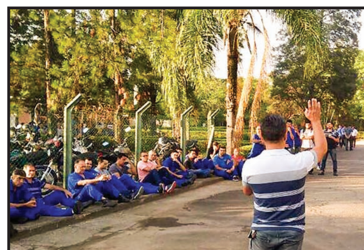
Assembleia Nagel do Brasil