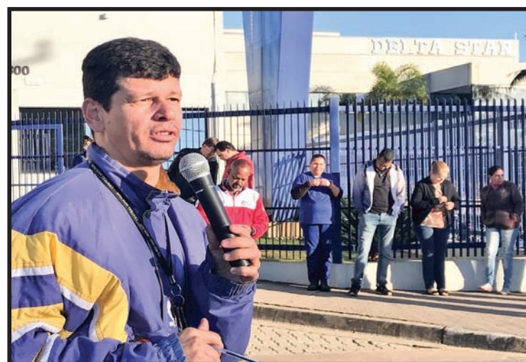
Assembleia na Empresa Delta Star