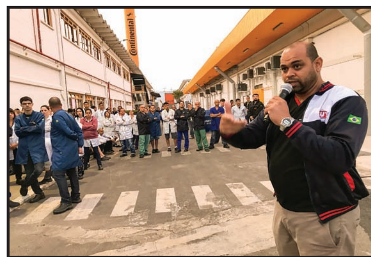
Assembleia na Empresa Continental