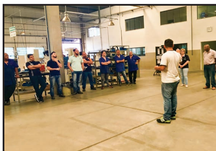
Assembleia na empresa Brunitec