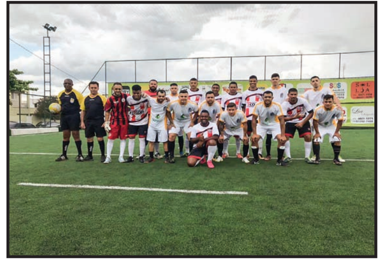
Times que disputaram o 1º e 2º lugares: TMD Cobreq Kamaradas X Altena