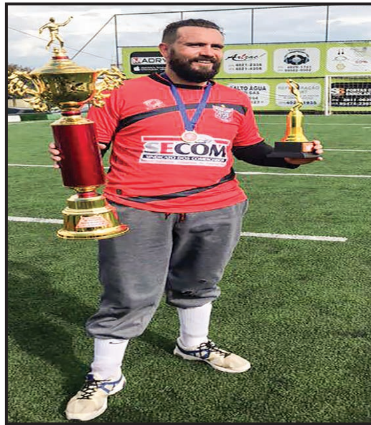
Goleiro menos vazado