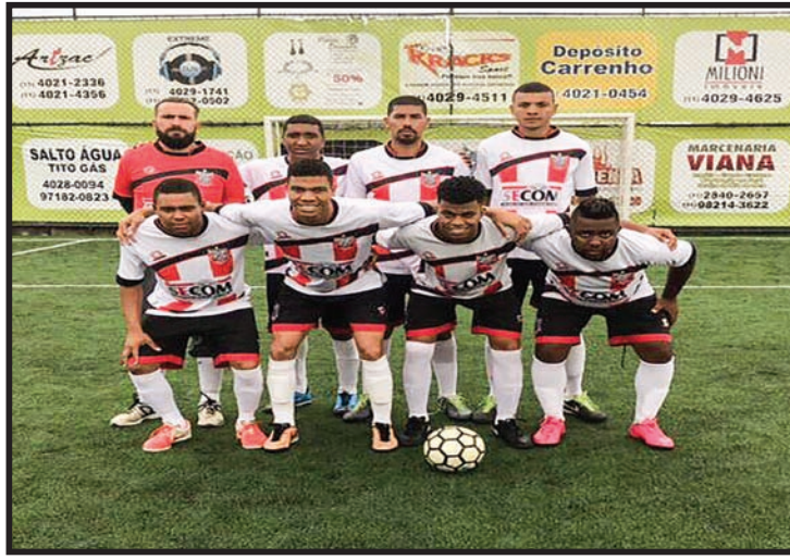
Time Campeão - Altena