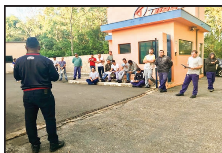
Assembleia na empresa Tupri