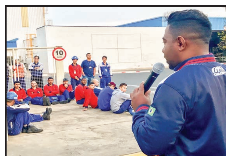
Assembleia na Kanjiko