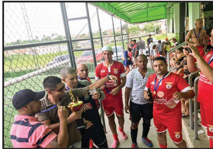
Torcida sempre presente