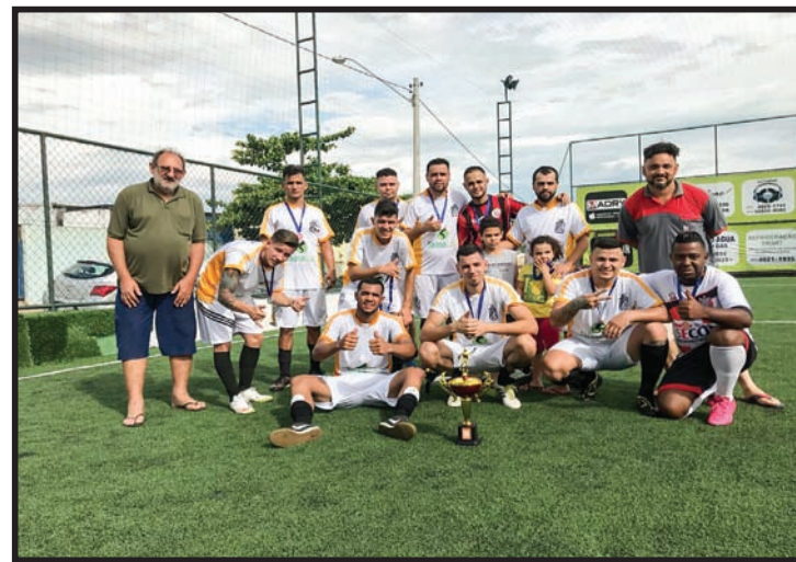
Vice Campeão - TMD Cobreq Kamaradas