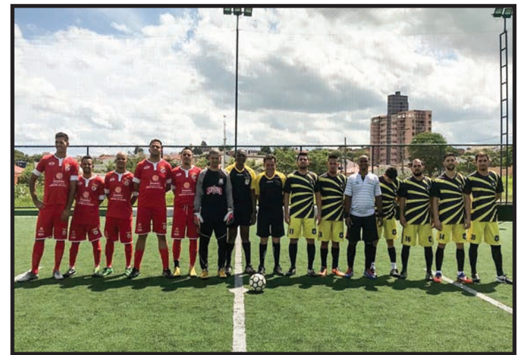
Times que disputaram o 3º lugar: TMD Cobreq Prensa X Kanjiko Rússia