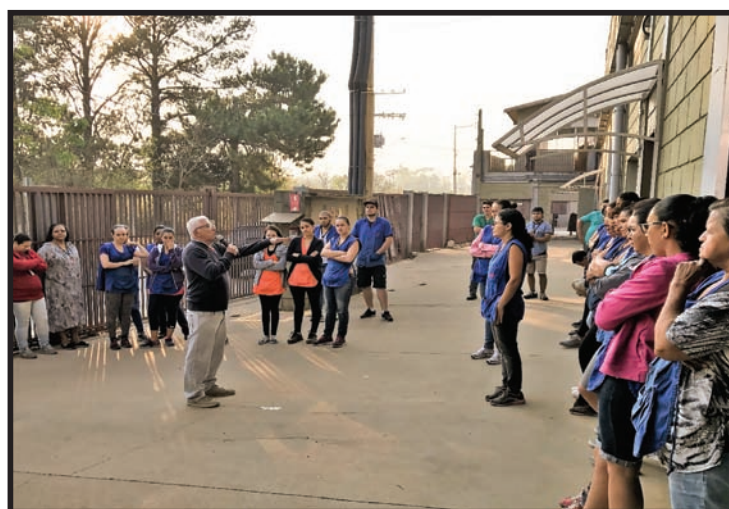
Assembleia na Empresa JM Fontana