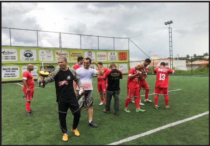
Comemoração do 3º lugar: TMD Cobreq Prensa