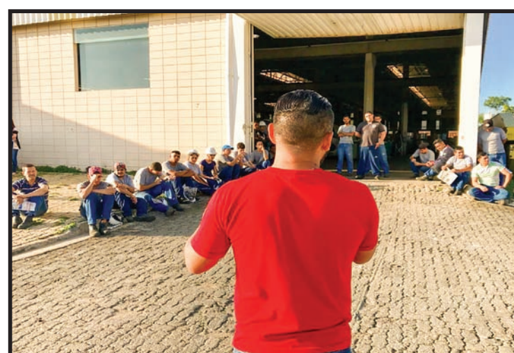
Assembleia na empresa MMS