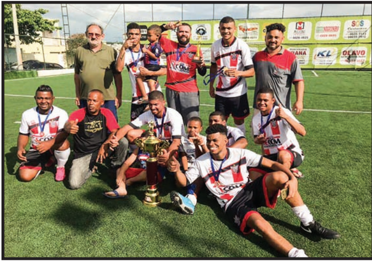
Comemoração do 1º lugar: Altena