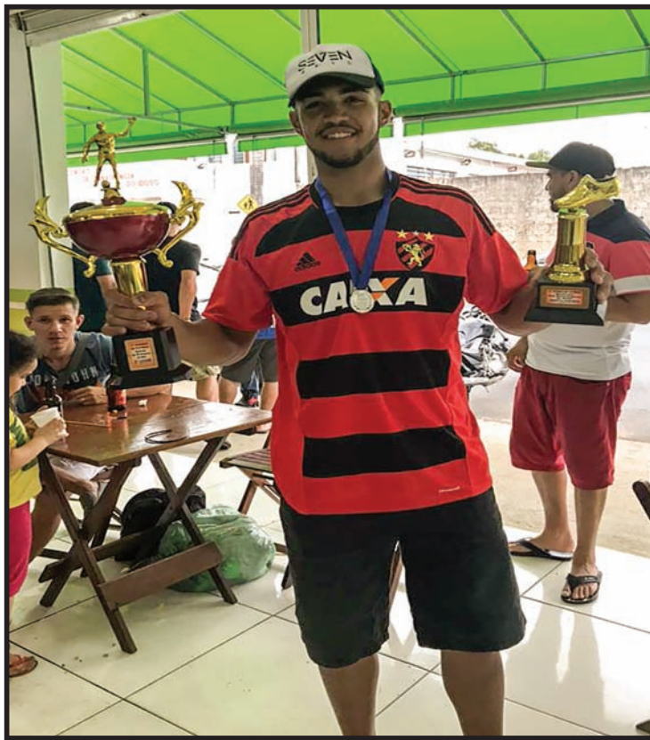
Artilheiro do Torneio