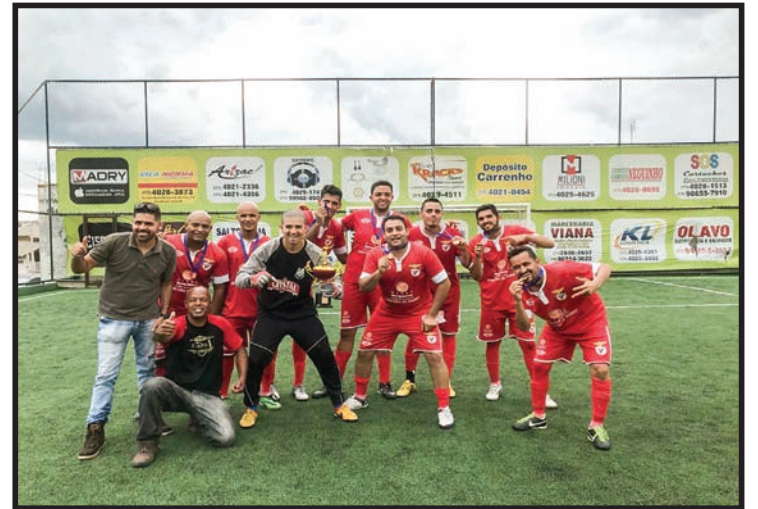
3º lugar: TMD Cobreq Prensa