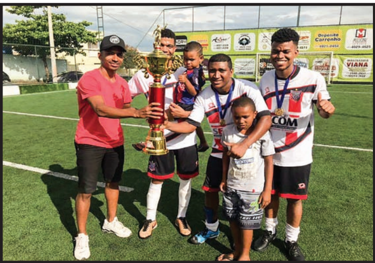
Comemoração do 1º lugar: Altena